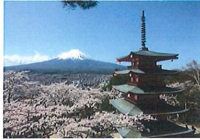
▲新倉山浅間公園 インバウンドに人気のスポット。春になると桜、富士山、五重塔を一目に見ることができるため多くの観光客が訪れる。富士急行線下吉田駅から徒歩で約10分。