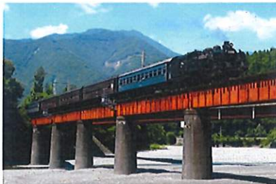
▲大井川沿いを走るSL列車の風景