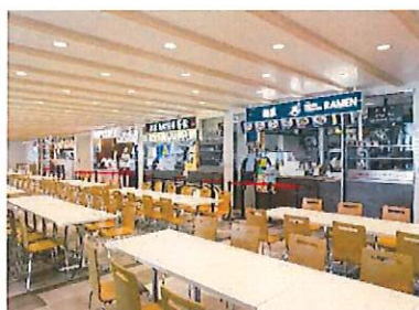
▲富士山静岡空港の「フードコートFSZ」 飲食店、物販店等が出店し、搭乗客だけではなく見学者も楽しめる空港へ。