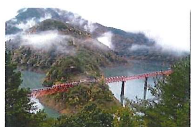
▲奥大井湖上駅の周辺風景 寸又峡温泉から車で約30分、南アルプスあぶとラインも好評。