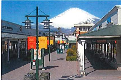
▲御殿場プレミアム・アウトレット 2020年4月16日に約90店舗の新規エリアがオープンし、日本最大のショッピングリゾートに。