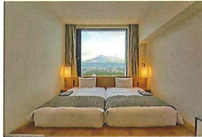
▲「HOTEL CLAD」(ホテル クラッド) 御殿場プレミアム・アウトレット内に2019年12月15日開業。