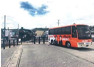
▲富士山静岡空港アクセスバス金谷・新金谷バス 空港からJR金谷駅までは約13分、大井川鉄道新金谷駅まで約18分で実証運行中。