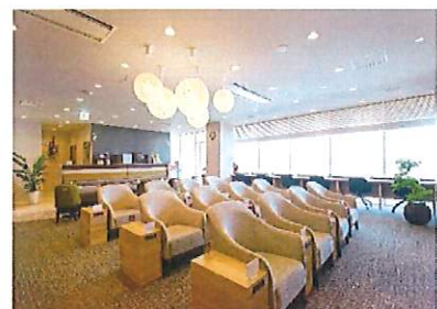
▲富士山も望めるビジネスカードラウンジ 様々なお客様の利用シーンに対応し、空港利用者の満足度を高めていく。