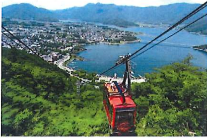
▲～河口湖～富士山パノラマロープウェイ 山頂の展望台からは富士山の大パノラマとどこまでも広がる裾野が一望できる。