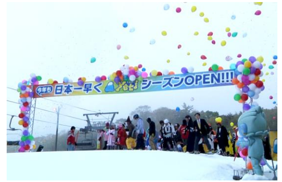
※昨年のセレモニーの様子