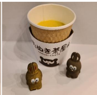
お月見ポタージュ (300円)