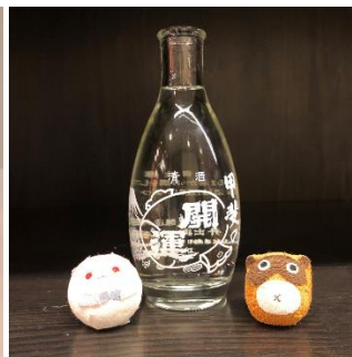
熱燗「甲斐の開運」 (400円)