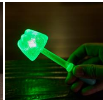
ふじちゃんフラッシュキャンデー (440円)