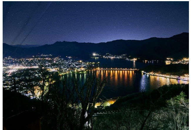
「絶景パノラマ回廊」から見る河口湖