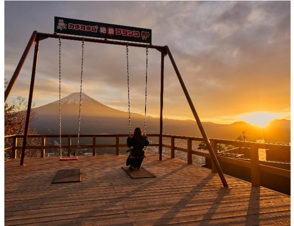
「カチカチ山 絶景ブランコ」から見る夕焼け