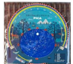
PICA オリジナル星座早見盤