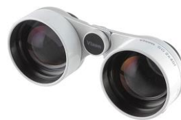
星空観察用双眼鏡