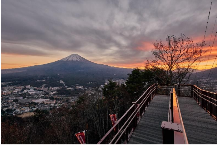
「絶景パノラマ回廊」から見る夕焼け

ロープウェイ山頂の展望広場や「絶景パノラマ回廊」からは、眼前に広がる大パノラマが一面鮮やかな夕焼け色に染まり、そこから段々と紫～濃紺へと変わっていく、空と富士山が織りなす絶景をお楽しみいただけます。「カチカチ山 絶景ブランコ」では、まさにその絶景に飛び込むようなとおきの非日常体験を味わうことができます。