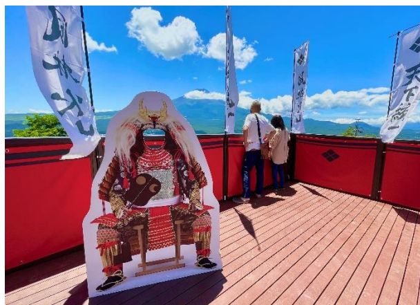
武田信玄なりきりフォトスポット