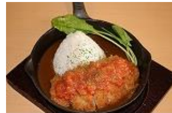
さっぱりトマツカツカレー 1,500円