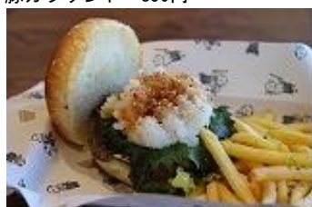
和風おろしバーガー 1,200円