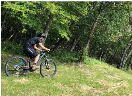
マウンテンバイクパーク

・パンプトラック用ストライダーレンタル: 30 分 500 円(税込)※ヘルメット必須