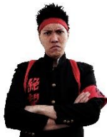
おにがしら だいがろう 鬼頭 大五郎

地獄塾五代目塾長の息子であり、幼き頃より絶望英才教育を受ける。190センチ 95キロの恵まれた体を持ちながら、声量がない絶望声（ゼツボイス）の持ち主。第66代絶望応援団団長。