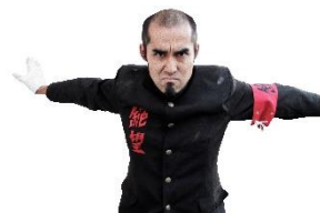
まゆげ ふとぞう 眉毛 太造

地獄塾五代目塾長の息子であり、幼き頃より絶望英才教育を受ける。190センチ 95キロの恵まれた体を持ちながら、声量がない絶望声（ゼツボイス）の持ち主。第66代絶望応援団団長。