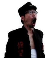
さめはだ へびまる 鮫肌 蛇丸

慶応元年より伝わる伝説の団旗“絶望旗”の正式な継承者。団旗の持ちすぎで胃下垂になった。