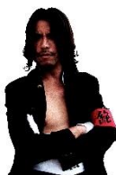
まうんてんじ マウンテン J

慶応元年より伝わる伝説の団旗“絶望旗”の正式な継承者。団旗の持ちすぎで胃下垂になった。