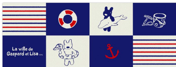
フェイスタオル 1,080円