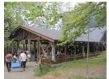
※イメージ(既存施設)