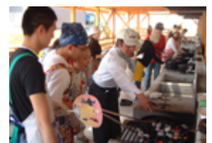
※画像は改装前のものです。