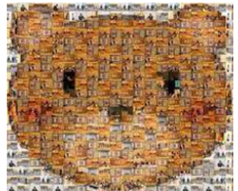
※イメージ(熊の部分がハートになります)