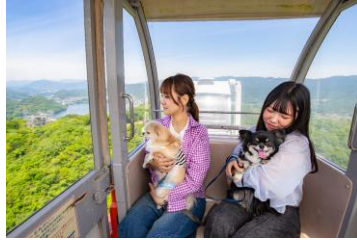
お山のかんらんしゃ