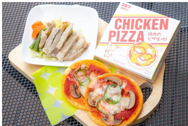
上:ワンダフルなポークソテー 800円