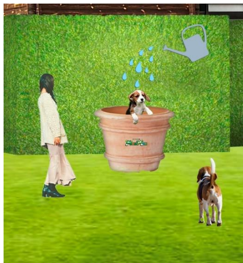
鉢植えフオトスポット ※イメージ