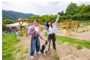
SASUKE キッズアドベンチャー