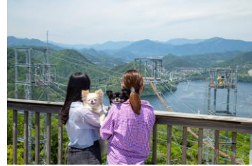
マッスルモンスター展望台