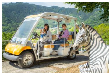
もりもりサファリ ぼうけんカート