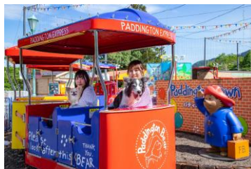
しゅっぱつ！パディントン号