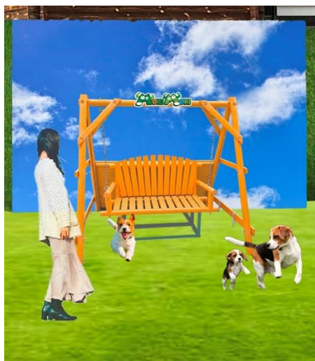
ブランコ型フオトスポット ※イメージ

ドッグラン内に緑の芝生に映える黄色いブランコや鉢植え型のフオトスポットが登場するほか、園内の各所にも忠犬ハチ公になりきれるお立ち台や、顔出しパネル、パディントンタウンにはロンドンバス風のフオトスポットなど、レジャーパークならではのフオトスポットが設置され、園内を散策しながら写真撮影が楽しめます。