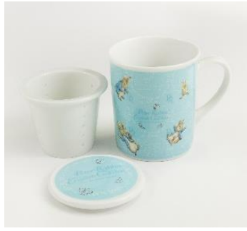
ティーストレーナー付きマグカップ 2,500 円