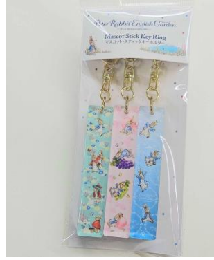
スティックキーホルダー (3 種セット) 2,000 円