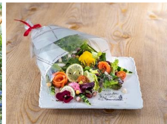
マグレガーおじさんの とれたて野菜のブーケサラダ 1700 円