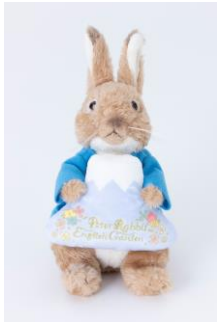
ぬいぐるみ 3,670 円