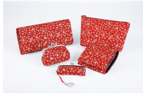
甲州印伝商品一覧