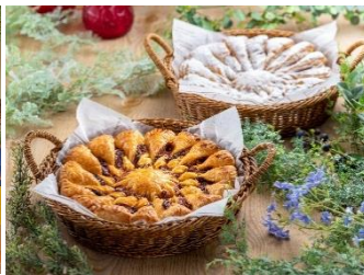
ブルームパイ 各 3800 円 上:ベリー&ホワイトチョコ 下:ミートソース