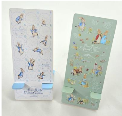
モバイルスタンド 800 円