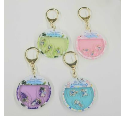
フレークキーホルダー(4 種) 1,100 円 ※4/20(土)より販売開始