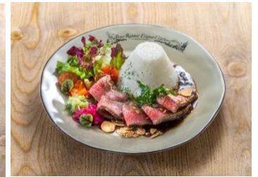
彩りローストビーフプレート 2800 円