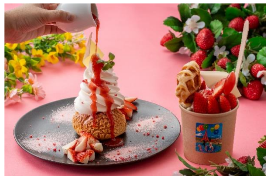
賞味期限イチゴ分！？のシュークリーム/クロッフルソフト