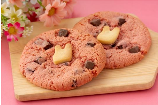
ストロベリーチャンククッキー