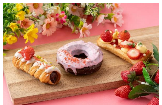
イチゴのオールドファッション 他