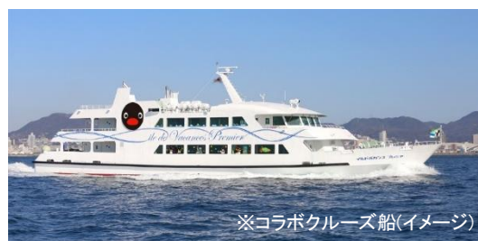
※コラボクルーズ船(イメージ)