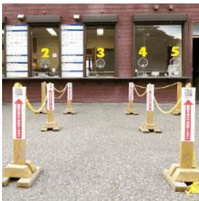
間隔を空けてお並びいただくようご案内を設置

スノーパーク「イエティ」では、「三密対策」と「お客様・スタッフの健康管理」の2つを軸に感染症予防対策を徹底しております。場内各所で実施している取り組みは下記の通りです。