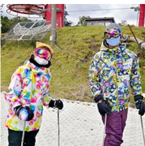
ゴーグル着用の推奨