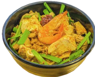
壺風旨辛スンドゥブ丼 (1,200円)