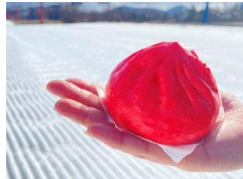
炎の真っ赤っ火まん (450円)