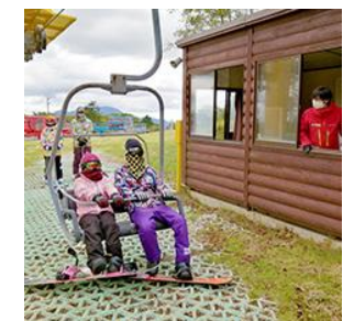
リフトはグループごとにご案内

※上記以外にも場内各所で感染症対策を実施しております。詳細は公式サイトにてご確認ください。