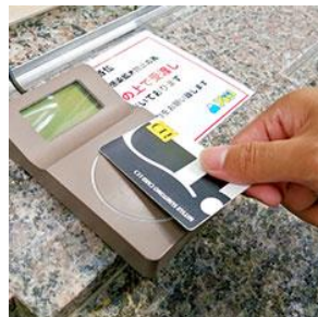
キャッシュレス決済を推奨