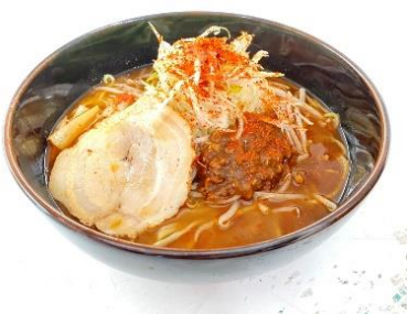
赤い壺監修 激辛味噌ラーメン (1,200円)

レストランでは、若者世代に人気の都内激辛有名店「赤い壺」とコラボしたさまざまな旨辛メニューを販売しております。地元の御殿場とうふを使用した「壺風旨辛スンドゥブ丼」やチャレンジメニュー「赤い壺監修激辛味噌ラーメン」といったイートインメニューをはじめ、「炎の真っ赤っ火まん」や「衝撃！唐辛子ソフト」といったテイクアウトメニューも充実しております。