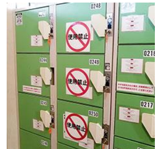
コインロッカー個数の制限