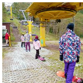
リフト乗車時および待ち列で間隔を確保