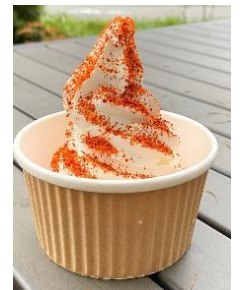
衝撃！唐辛子ソフト (450円)