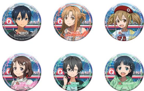
TD缶バッジ 全6種 各594円（税込）