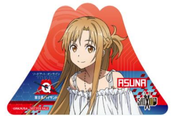
ステッカーイメージ