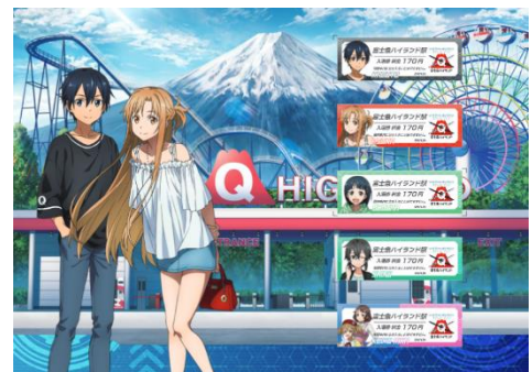
駅入場券セットイメージ