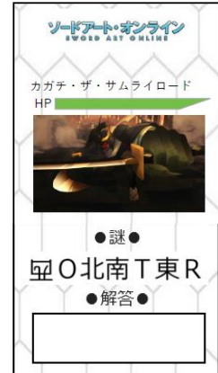
ゲーム画面イメージ

詳細はコチラ https://game.nazotown.jp/sao10th/