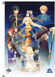
B2タペストリー 3,240円（税込）