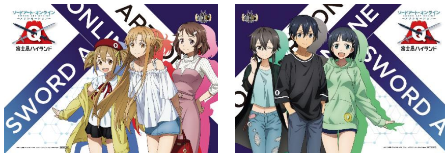
ランチョンマットイメージ