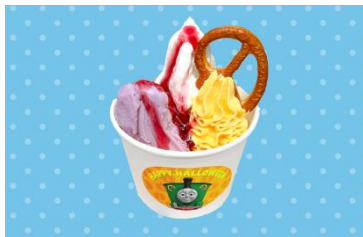
パンプキンホイップと紫いもの アイスクリームサンデー 650 円