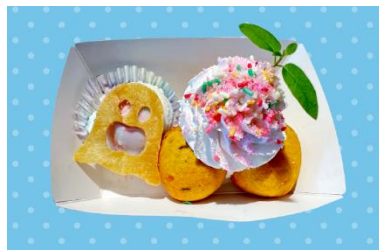
おばけの3色アイスと カボチャドーナツ 900 円