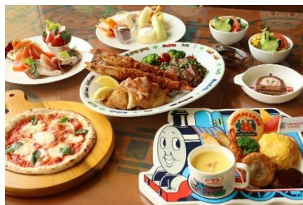
トーマスルーム・パーティーセット