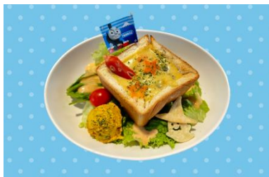
カボチャシチューの いたずら BOX 1,300 円