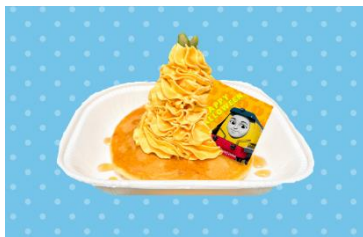
レベッカのハロウィンパンケーキ (パンプキンとメイプル味) 650 円